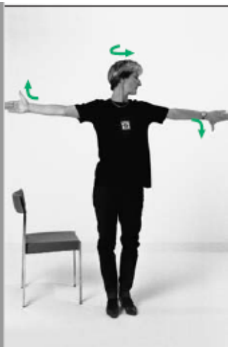
Quarto esercizio - Distensione dei muscoli laterali della nuca.

Esercizio Sollevare le spalle e restare così per un istante. Rilassare in seguito le spalle. Ripetere l'esercizio da 10 a 15 volte.